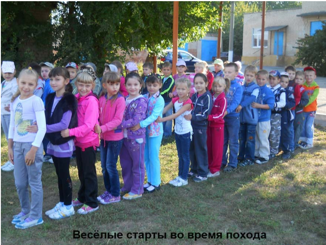
Весёлые старты во время похода