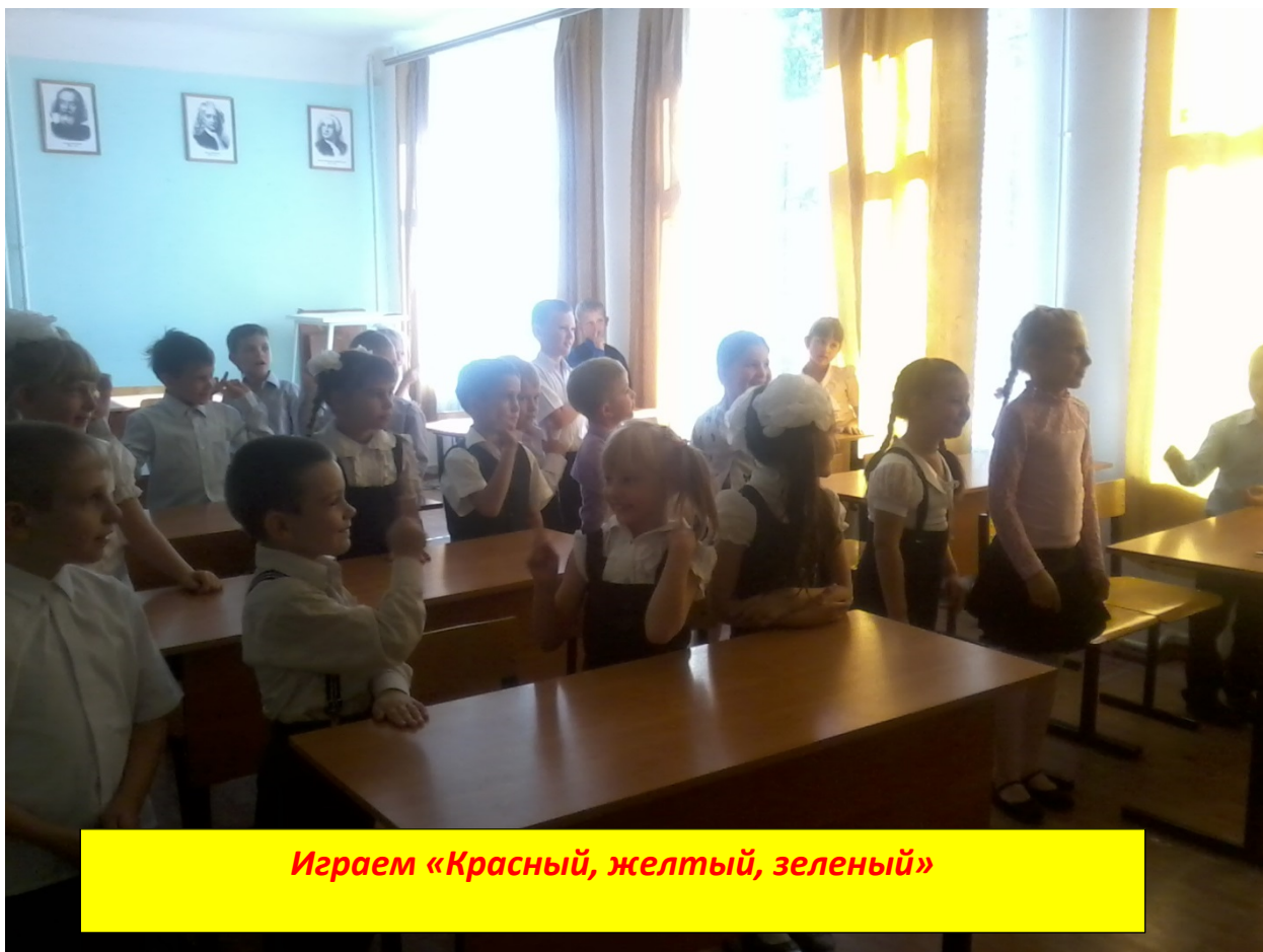
Играем «Красный, желтый, зеленый»

первоклассникам было предложено нарисовать безопасный путь домой, чтобы строго следовать ему. Мы надеемся, что малыши запомнили главное правило безопасности, которое позволит им сделать безопасным любой путь, любую дорогу.