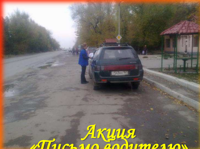
Акция «Письмо водителю»