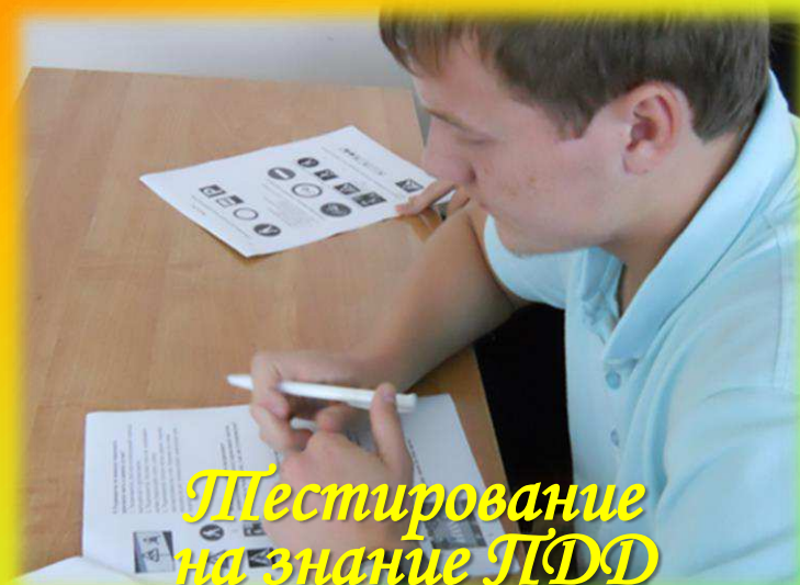
Тестирование на знание ПДД