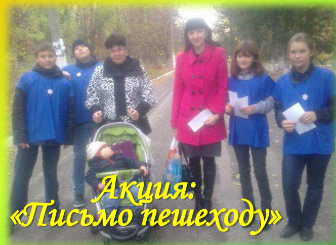
Акция: «Письмо пешеходу»